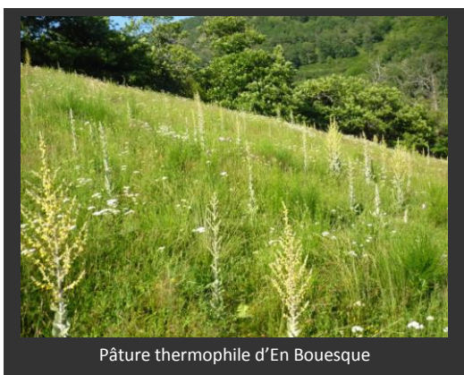
Pâtûre thermophile d'En Bouesque