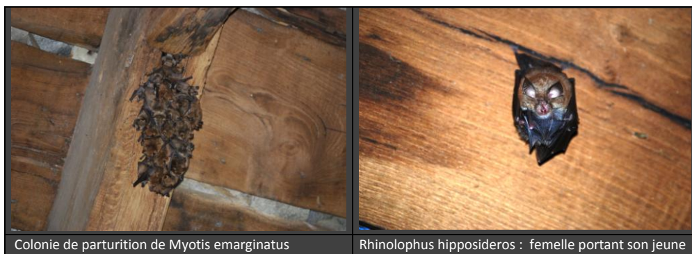
Colonie de parturition de Myotis emarginatus

S'assurer de celles-ci chaque année, tout en effectuant un décompte précis des populations (âge et sex-ratio) renseignent à la fois sur les dynamiques de populations comme sur l'état de conservation des gîtes et de leurs occupants.