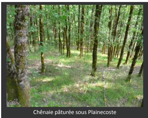
Chênaie pâturée sous Plainecoste