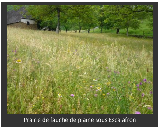
Prairie de fauche de plaine sous Escalafon