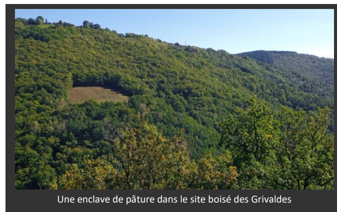
Une enclave de pâture dans le site boisé des Grivaldes

Son chargé d'étude spécialisé sur les chauves-souris restera en charge de cette animation, à hauteur d'environ 15 % de son temps de travail annuel 2021.