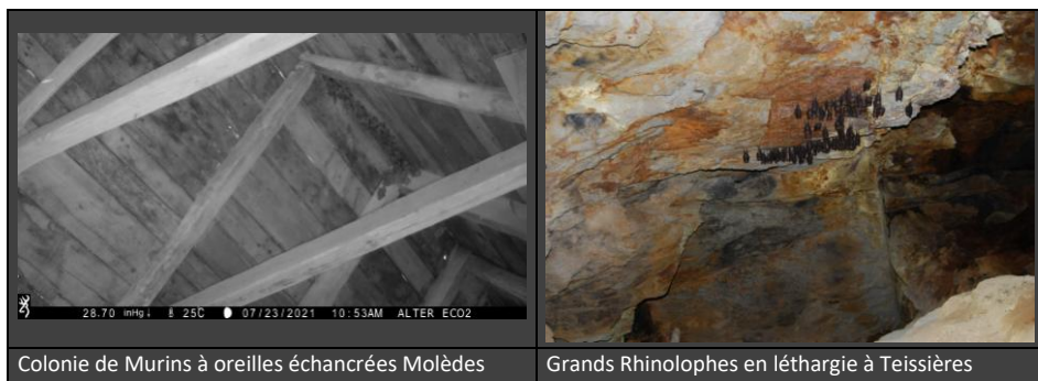
Colonie de Murins à oreilles échanquées Molèdes

La colonie de Murins à oreilles échanquées de Molèdes dont on craignait la fragilité des effectifs a battu des records avec pas moins de 72 femelles donnant 71 juvéniles. Ce décompte précis est du au monitoring vidéo que nous avons pu envisager grâce à la complicité de la propriétaire du gîte, toujours aussi solidement déterminée à avantager ses petites protégées. Le dispositif vidéo a rempli pleinement sa mission en documentant la chronologie d'occupation du gîte (la colonie arrivée fin mai est repartie dans les derniers jours d'août) ainsi que les horaires de ses sorties et rentrées nocturnes. On a pu voir aussi les mouvements diurnes au grès des fluctuations de température qui dans une grange couverte en lauze rendent parfois étouffantes les situations au faitage.