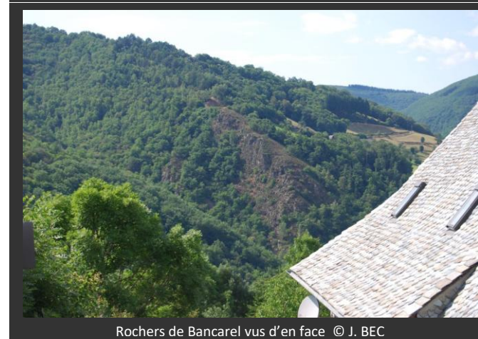
Rochers de Bancarel vus d'en face