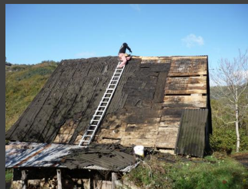
Appentis des Aurières avant travaux

Ces petits travaux conservatoires 2016 ont donc bénéficié d'une partie du budget alloué à la mission d'animation.