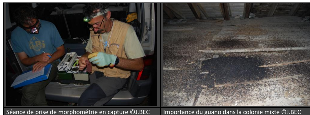
Séance de prise de morphométrie en capture