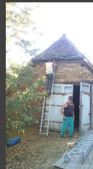
Grangette du Mas, fin de travaux, avec le propriétaire