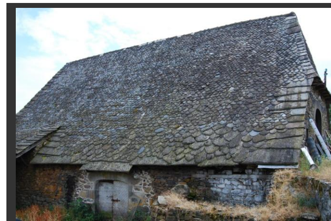
Grange propice aux chauves-souris à Murols-Soubeyre

Son chargé d'étude spécialisé sur les chauves-souris est en charge de cette animation à hauteur de 20 % de son temps de travail annuel.