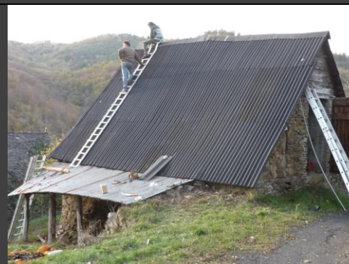
Appentis des Aurières, fin de chantier avec le propriétaire