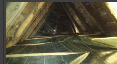
Grangette du Mas, rendu de la bâche posée