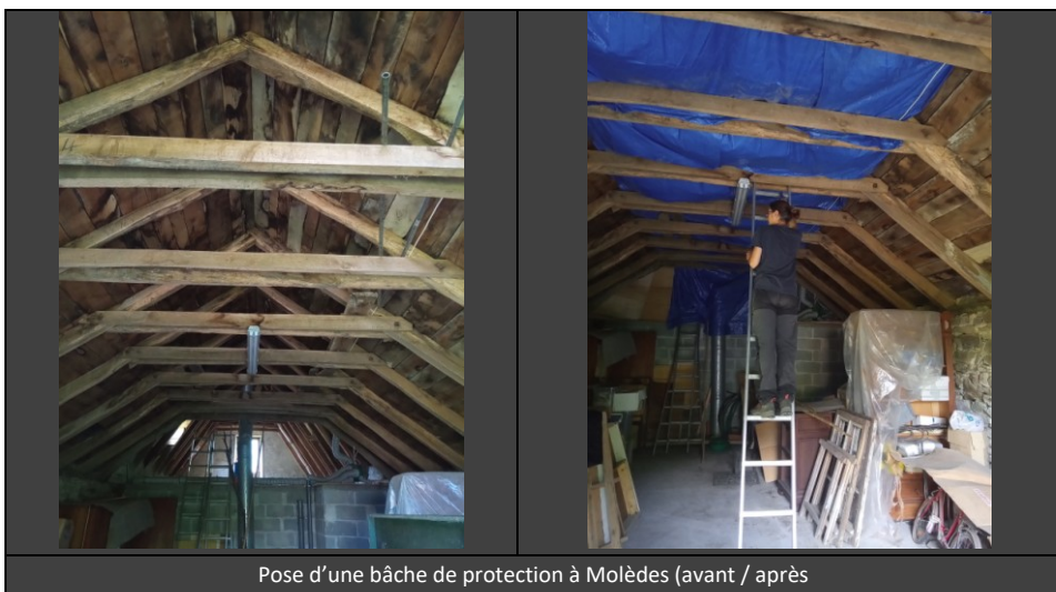
Pose d'une bâche de protection à Molèdes (avant / après)

Nos animateurs avaient l'expérience de pose d'une bâche puisque c'est grâce à ce dispositif que nous avons pu convaincre le propriétaire d'une grange au Mas, de conserver la colonie de reproduction de Petits Rhinolophes. Ici à Molèdes le comble était plus vaste, la jonction avec l'autre grenier, avec passage de gaine de vmc, rendait la tâche plus délicate. Une journée de travail à deux a été nécessaire.