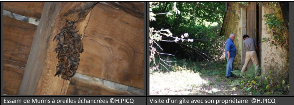
Essaim de Murins à oreilles échanrées

Tous les gîtes connus dans le périmètre ont été visités cette année, et la reproduction battant son plein au moment des décomptes, une approche du succès à la reproduction est possible. L'effectif global est conforme à ceux des années précédentes, sachant qu'il manque une estimation de la population occupant la falaise des Grivaldes (cf. par ailleurs)