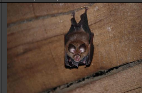
Femelle de Petit Rhinolophe portant son jeune