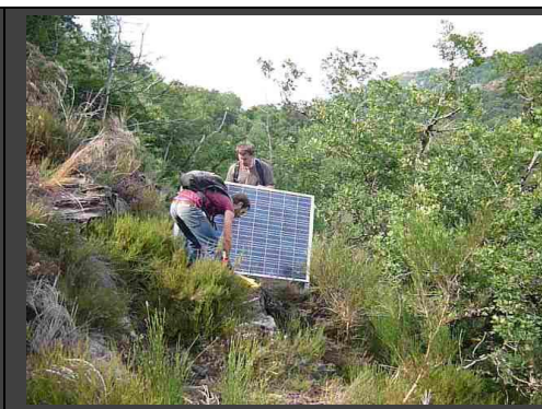
Mise en place du panneau solaire, sommet falaise