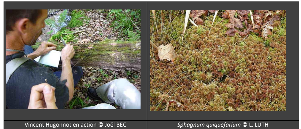
Vincent Hugonnot en action

Le Conservatoire Botanique du Massif-Central a donc été à nouveau sollicité afin de dépêcher un des meilleurs spécialistes français des mousses pour inventorier le site.