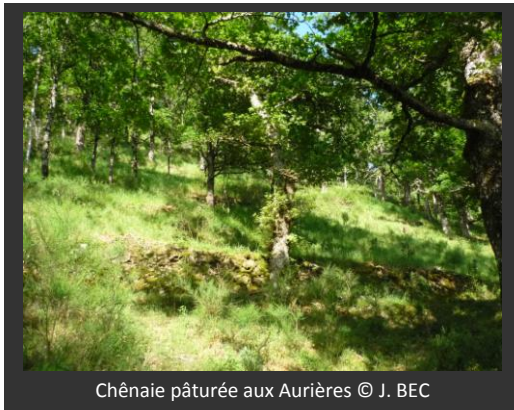
Chênaie pâturée aux Aurières