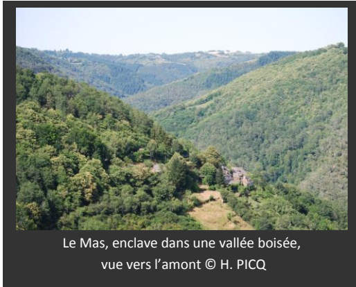
Le Mas, enclave dans une vallée boisée, vue vers l'amont

La pertinence des contrats « ni, ni » n'apparaît pas non plus malgré le fort besoin lié à la conservation de toitures de certains gîtes occupés par des chiroptères. La question des investissements nécessaires par les propriétaires pour préserver leurs biens fait blocage en ces temps de crise.