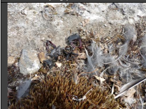
Relief de repas des Faucons pèlerin (lucane, oiseaux)