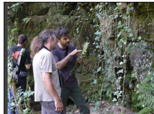
Sortie bryologique sur les bords du Goul

Des sorties grands publics autour d'une présentation des richesses du site en suivant les tronçons du chemin clunisien pourrait donner de l'audience au dispositif Natura 2000.